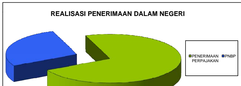
Grafik III. Realisasi Penerimaan Dalam Negeri

D.2.1.1.1. Penerimaan Perpajakan 618.825.739.540,-