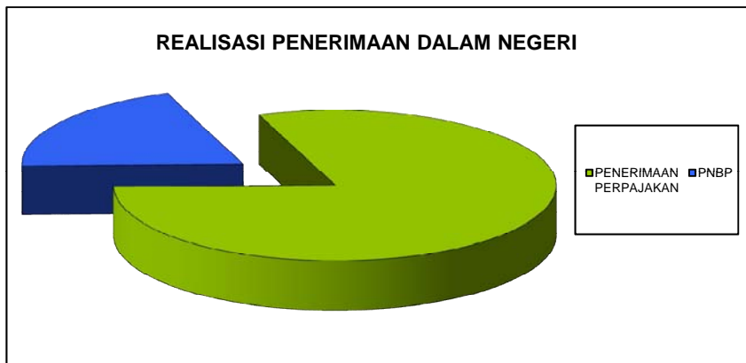
Grafik III. Realisasi Penerimaan Dalam Negeri

D.2.1.1.1. Penerimaan Perpajakan 1.064.383.892.738,-